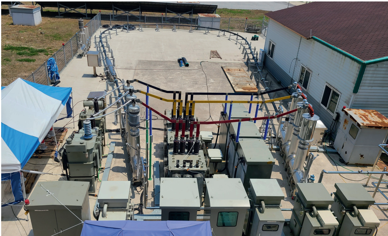
Typentest eines HTS-Kabels (23 kV 60 MVA) in Gochang.