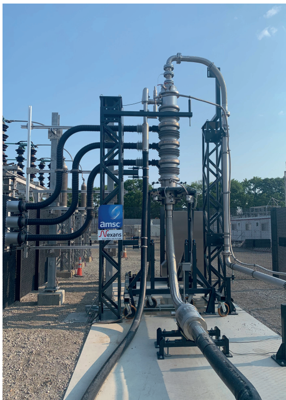
Projekt eines HTS-Kabels in Chicago im US-Bundesstaat Illinois.