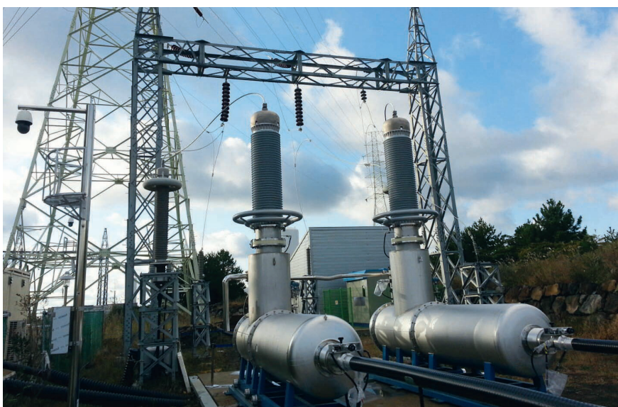
Endpunkt eines supraleitenden Gleichstromkabels mit 80 kV Spannung in Südkorea.