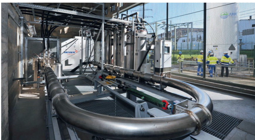
Supraleitende 10-kV-Stromleitung, die von April 2014 bis März 2021 in der Innenstadt von Essen genutzt wurde. Rechts ausserhalb des Gebäudes steht der Stickstofftank.